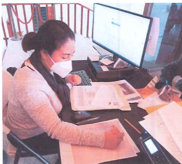
Verificando la lista de maestros con el numero correspondiente

Se apoyó en verificar en los listados el nombre de los maestros en su orden correlativo y trasladado a una hoja en limpio si fue ausente o dando la observación correspondiente