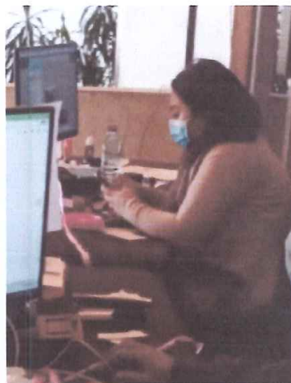
Ayudando a una maestra a concertarse a la red wifi