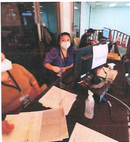
En la recepción de documentos

Se apoyó en la mesa de recepción recibiendo la documentación de cada artista en la cual es entregada de manera personal por cada artista, primeramente, recibiendo su número de cita, segundo recibiendo su documentación para ser revisada e ingresada en la base de dato y verificando datos en los listados de los números proporcionados.