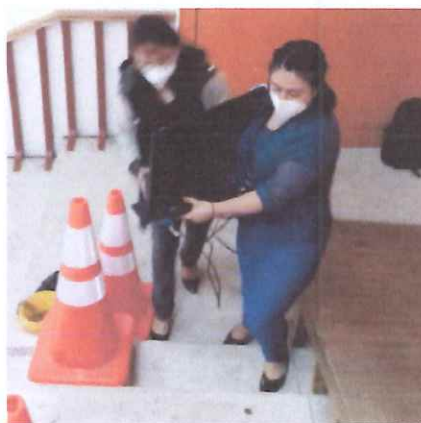
traslado de equipo

Se apoyó trasladando las mesas con los equipos de lunes a jueves a la entrada de la galería y solicitando que la puerta fuese cerrada con llave, los días viernes se apoyó en el desmontaje del equipo de computación, las mesas e útiles para dejarlos en el salón de jurídico para ser instalados el da lunes .