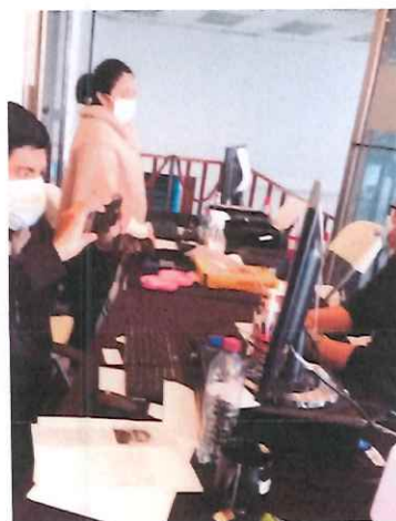
Llamando al siguiente maestro